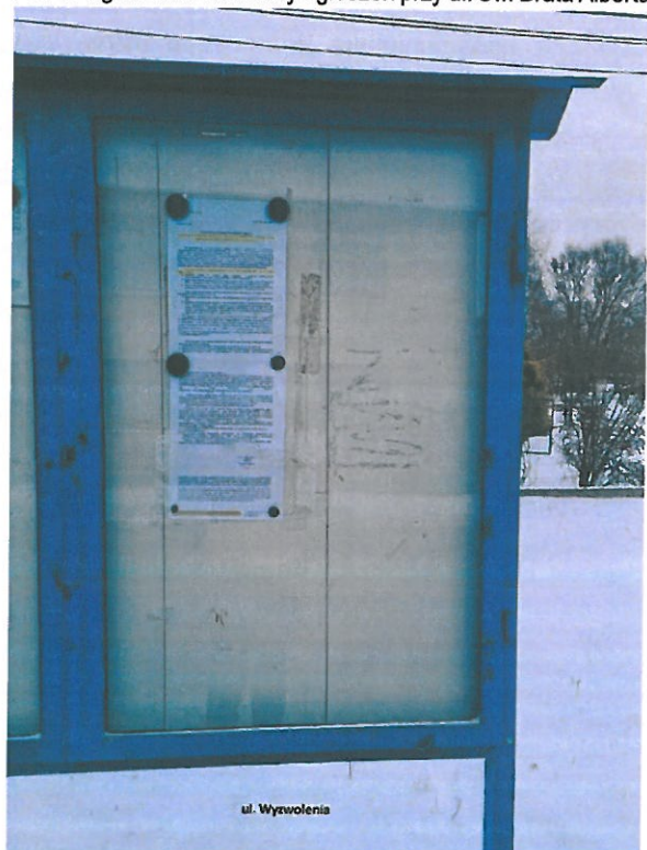
Fot. 9. Ogłoszenie na tablicy ogłoszeń przy ul. Wyzwolenia.