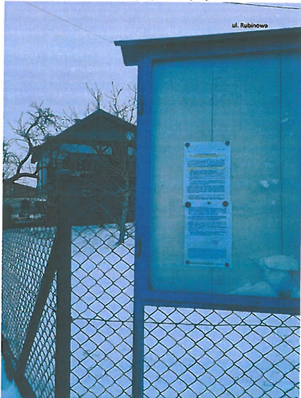
Fot. 8. Ogłoszenie na tablicy ogłoszeń przy ul. Rubinowej.