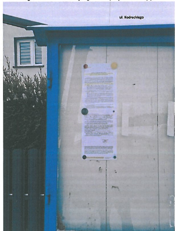
Fot. 5. Ogłoszenie na tablicy ogłoszeń przy ul. Kordeckiego.