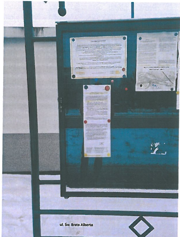
Fot. 7. Ogłoszenie na tablicy ogłoszeń przy ul. Św. Brata Alberta.