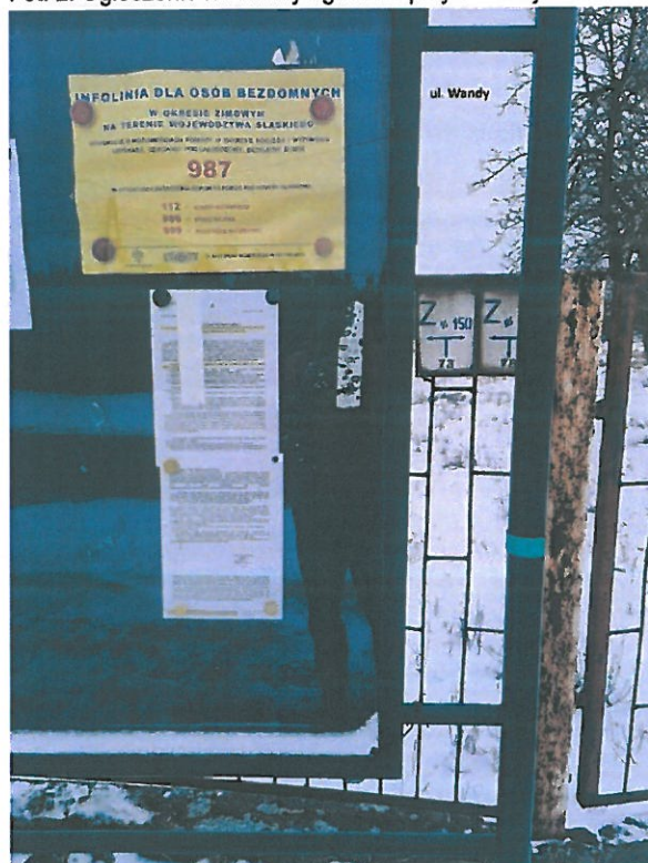
Fot. 4. Ogłoszenie na tablicy ogłoszeń przy ul. Wandy.