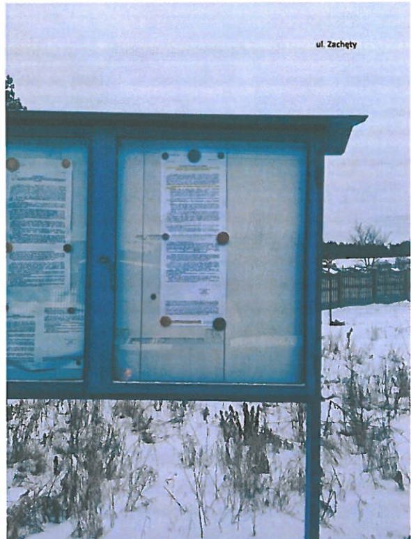
Fot. 3. Ogłoszenie na tablicy ogłoszeń przy ul. Zachęty.