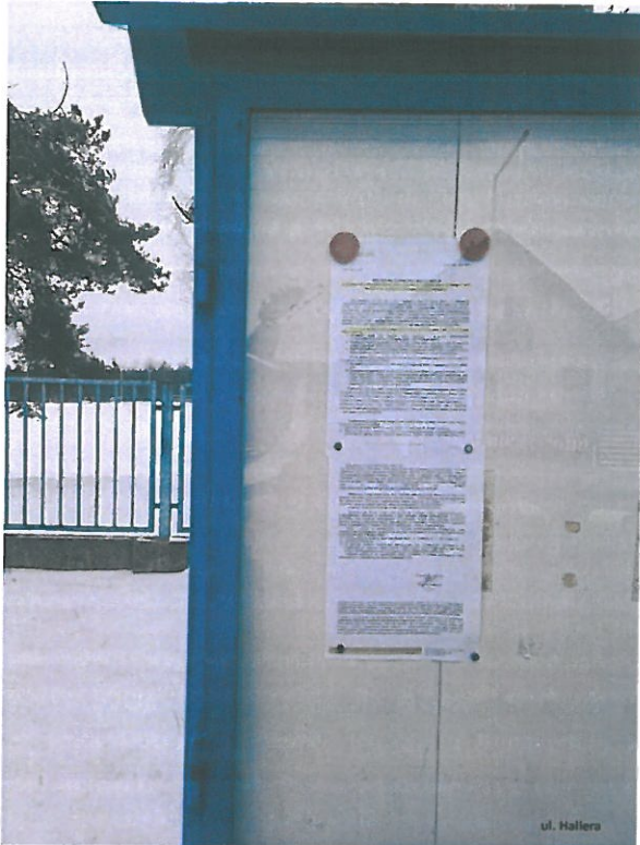
Fot. 6. Ogłoszenie na tablicy ogłoszeń przy ul. Hallera.