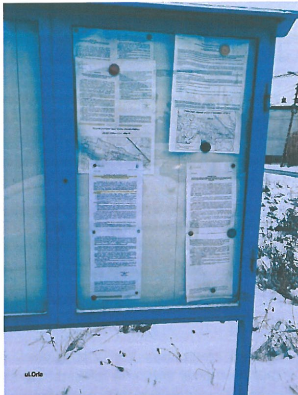
Fot. 2. Ogłoszenie na tablicy ogłoszeń przy ul. Orlej.