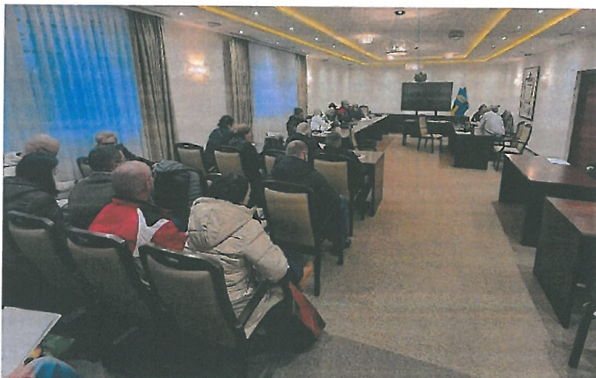
Fot. 11. Punkt konsultacyjny.

W celu zapewnienia udziału możliwie szerokiego grona interesariuszy konsultacje społeczne zostały przeprowadzone dodatkowo w formie: